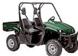
Rhino 660 Grün