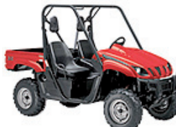
Rhino 660 Rot