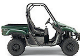
Rhino 660 Grün