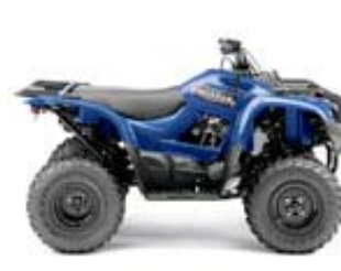
Grizzly 300 Blau

Technische Daten / Spezifikationen: Grizzly 300 2x4