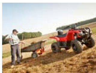
Grizzly 300 Arbeit