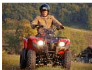
Grizzly 300 Action

Verfügbare Farbvarianten / Motive: Grizzly 300 (2x4)