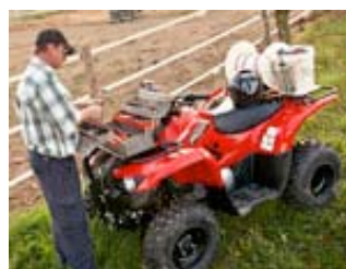
Grizzly 300 Rot