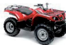
Grizzly 350 Rot