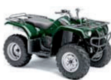
Grizzly 350 Grün