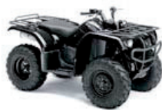
Grizzly 350 Schwarz

Verfügbare Farbvarianten / Motive: Grizzly 350 (4x4)