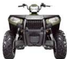
Sportsman H.O. Grün