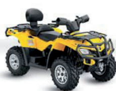
Outlander 400 MAX XT