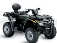
Outlander MAX Grün