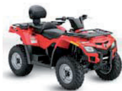
Outlander 400 MAX Rot

Verfügbare Farbvarianten / Motive: Outlander 400 MAX (XT)