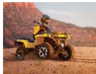
1000 XT Action