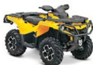
1000 XT Gelb