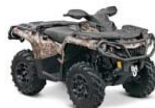
1000 XT Camo