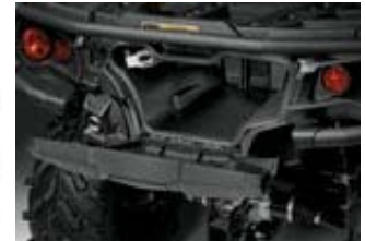
1000 XT Detail

Technische Daten / Spezifikationen: Outlander 1000 (XT)