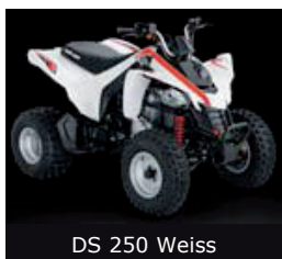
DS 250 Weiss