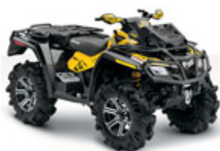
Outlander 800R X mr

Verfügbare Farbvarianten / Motive: Outlander 800 R (Max) EFI MR