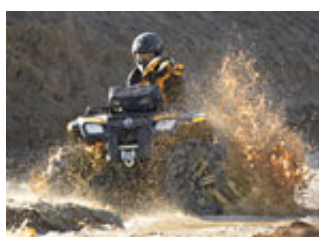
Outlander 800R X mr

Technische Daten / Spezifikationen: Outlander 800R (MR)