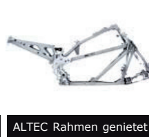
ALTEC Rahmen genietet