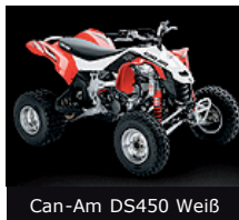
Can-Am DS450 Weiß