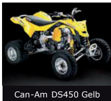
Can-Am DS450 Gelb